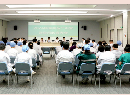
结合党纪学习教育，医院将

切实把思想和行动统一到中央、市委、区委、卫健委的决策部署上来，统一到医院三级康复评审等中心工作上，为健康海淀高质量发展提供更加坚强的政治保障。文/党办