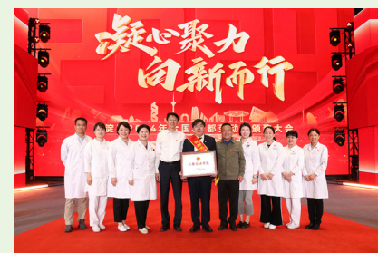
北京市中关村医院荣获“2024年首都劳动奖状”。