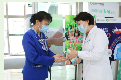
医院开展以“院感防控，‘净’在手中”为主题手卫生宣传活动。