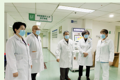
医院开展安全巡查，切实压紧、压实安全生产责任。