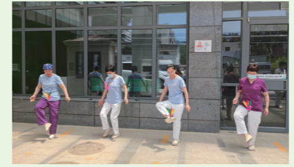
为增强团队凝聚力和向心力，养成良好的全民健康的方式，形成崇尚运动、健康向上的良好风气，医院开展“趣”康工作“快乐生活”主题活动。