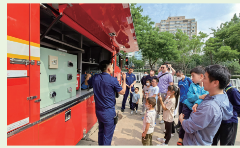
医院开展职工子女家庭消防体验活动，让孩子们零距离感受消防，“沉浸式”学习消防知识。