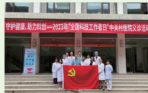
在全国科技工作者日中关村医院走进中科院机关开展“守护健康 助力科创”关爱科技工作者健康义诊。您为祖国殚精竭虑，我们为您保驾护航！