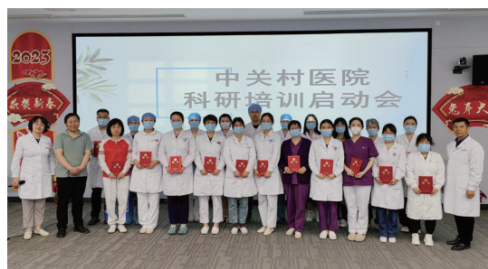
中关村医院临床科研初级进阶培训启动会

科室弥补科研短板，增强多学科协同合作，提高临床人员整体科研能力，切实惠及患者，为推进健康中国建设贡献力量。文/王建荣（科教科）