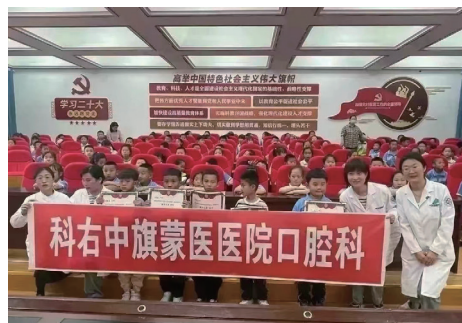
科右中旗蒙医医院口腔科

中关村医院将持续发挥自身优势，播下一颗又一颗种子，为更好地服务百姓贡献力量。文/周俊红 董晓婕（口腔科）