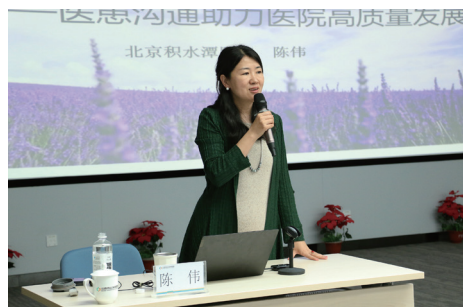
医患沟通助力医院高质量发展

主动治理，推动“接诉即办”走向“未诉先办”，中关村医院将举全院之力，上下联动，聚焦工单中突出反映的问题与群众诉求，推动各方力量积极作用，在推动主动治理中树牢“人民至上”“以患者为中心”的工作理念，助力医院高质量发展。文/董办