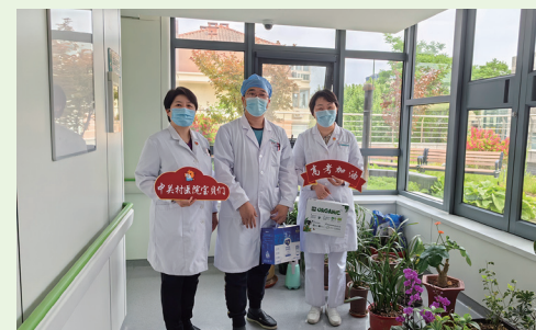
为充分发挥工会的桥梁纽带作用，医院组织开展2023年度“助力高考 爱心相伴”活动。为考生家长鼓劲加油，预祝村里的孩子们逐梦前行、金榜题名。