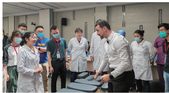
整脊技术学术论坛现场